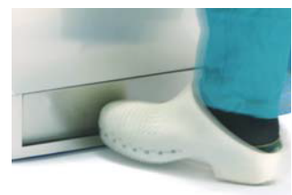
Dør åpning / lukking fotpedal.

Prosedyre hvis følgende alarm vises i displayet: